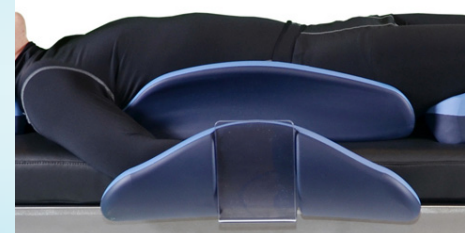
Matelas repose-bras sous le matelas